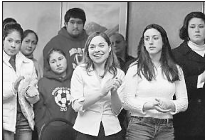
Estudiantes de Brewster High School and Eastern Washington University viajaron a Olympia in February tpara animar a la legislatura del estado a que aprueban fondos para los futuros profesores.

Este folleto también explica el decreto SUEÑO (DREAM son las siglas en inglés), una propuesta de ley que está actualmente siendo considerada en el Congreso de los Estados Unidos. Si el Congreso aprueba el decreto SUEÑO esto permitiría que los estudiantes indocumentados pudieran vivir, trabajar y asistir a la universidad en los Estados Unidos, y podría conducir a obtener residencia legal permanente y/o la ciudadanía.