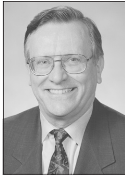
State Senator Don Carlson