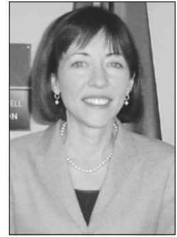
U.S. Senator Maria Cantwell