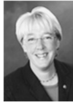
U.S. Senator Patty Murray