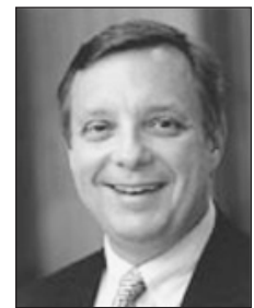
El Senador Orrin Hatch (R-Utah) y el Senador Richard Durbin (D-IL), copatrocinadores del Acta del SUEÑO, han ganado mucho apoyo de ambos partidos en el Senado de los Estados Unidos.