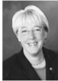
U.S. Senator Patty Murray